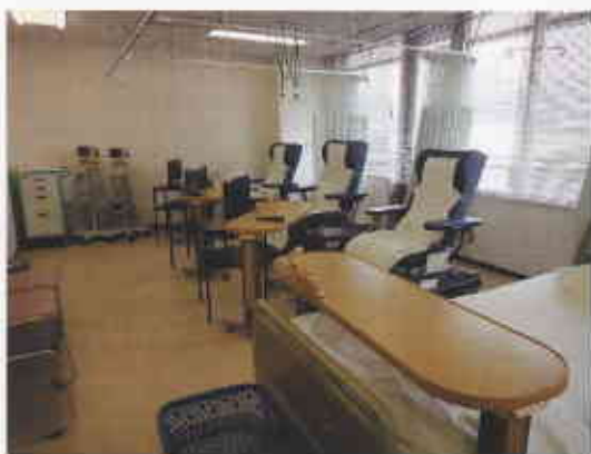
くつろぎながら化学療法を受けていただける外来治療室

私たち外来治療室看護師は、患者様に起こりうる、または起こっている身体的症状について情報提供やセルフケア指導を行いながら、症状や治療・疾患によってもたらされる心理・社会的苦痛に対しての関わりを行っています。患者様が「確実・安全・安楽」にがん化学療法を受け、生活の質を維持できるよう、そして「大手前病院で治療を受けて良かった！」と思って頂けるよう日々研鑽していきたいと思います。